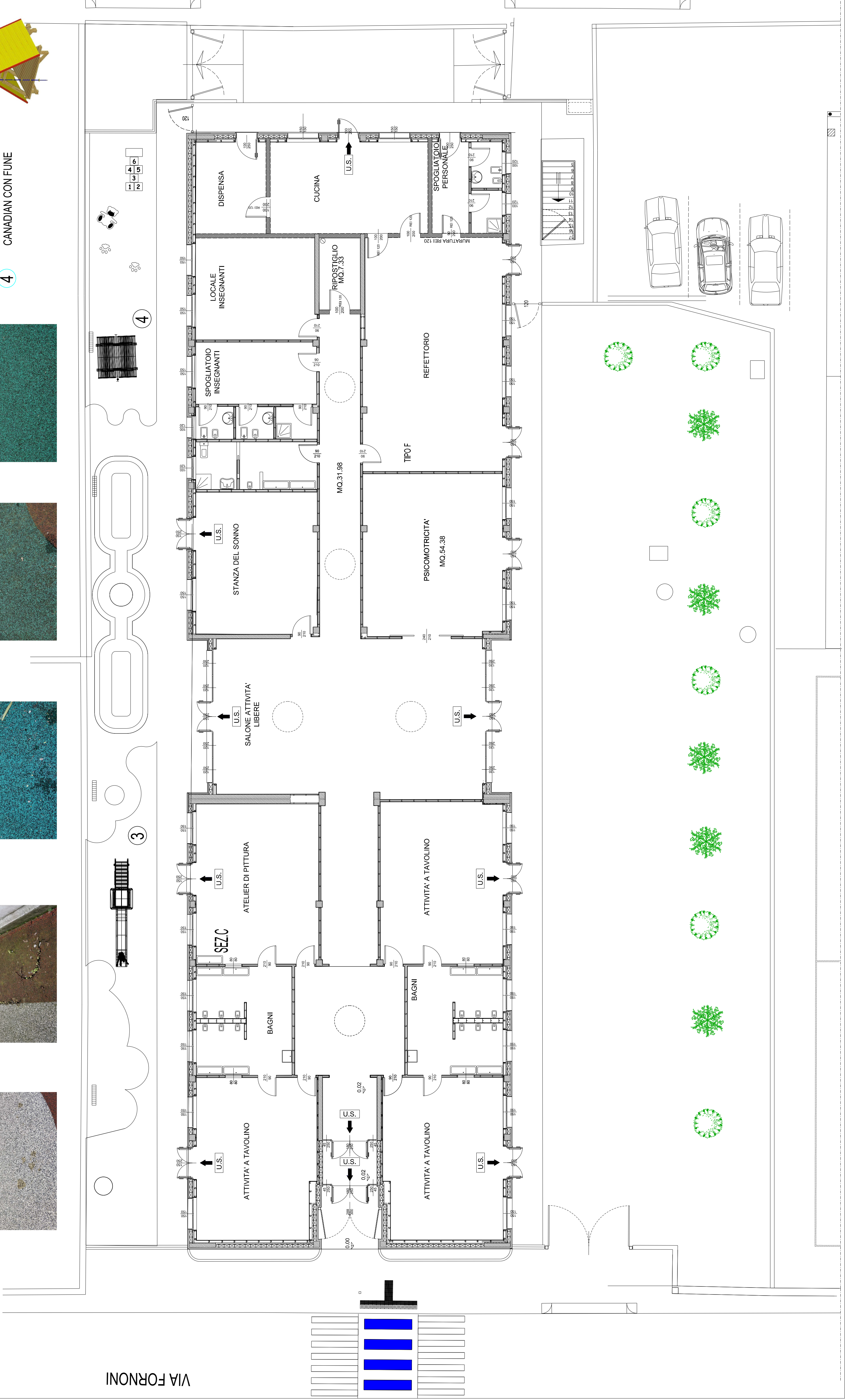
4 CANADIAN CON FUNE